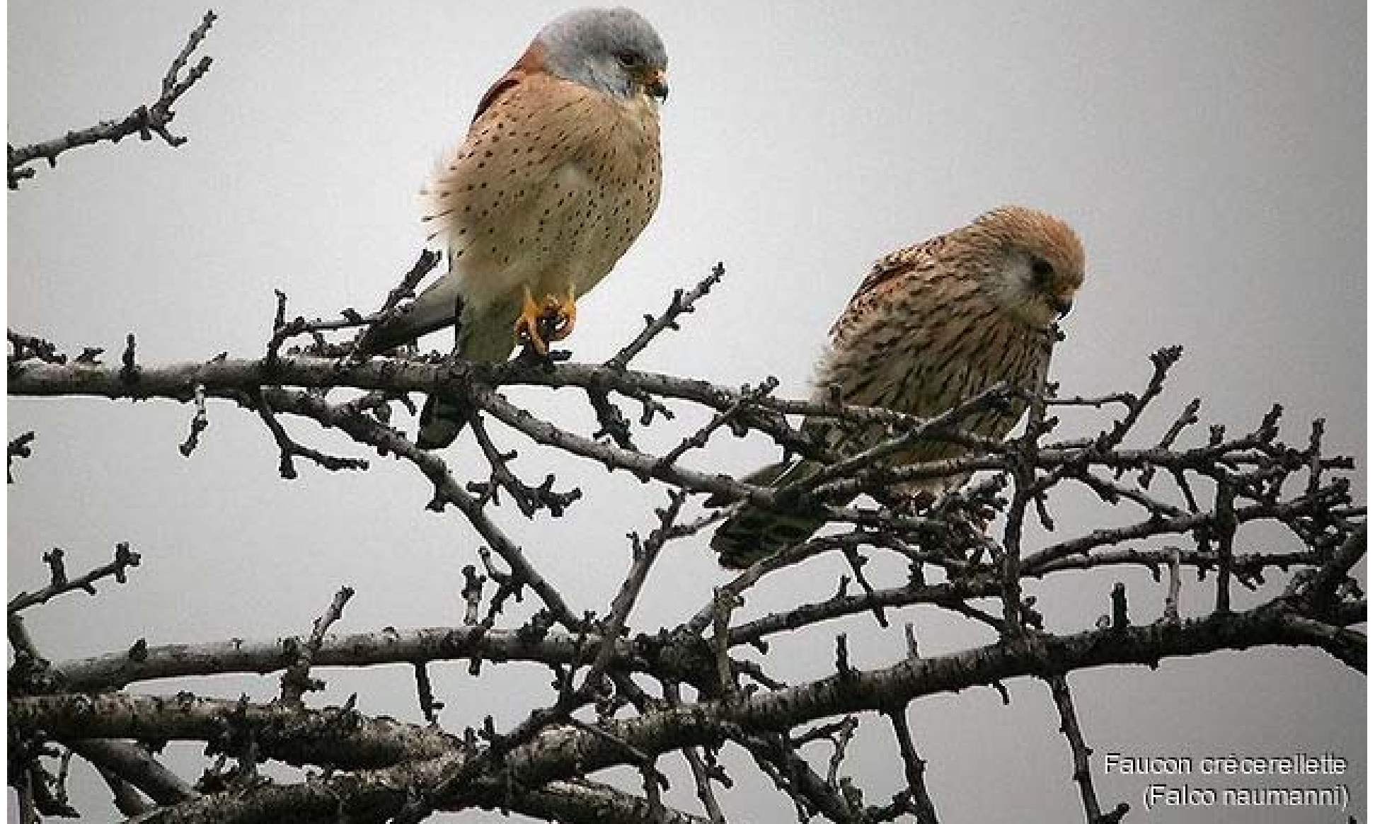
Faucon crécerellette (Falco naumanni)