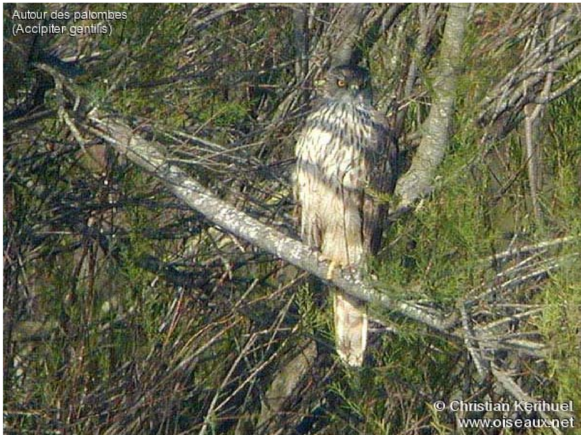
Autour des palombes (Accipiter gentilis)